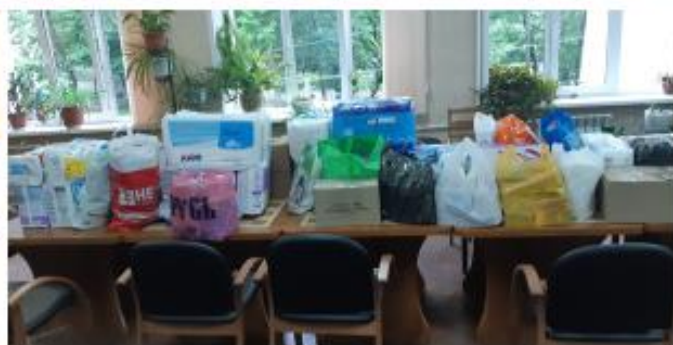
Помощь малоимущим, пожилым и инвалидам